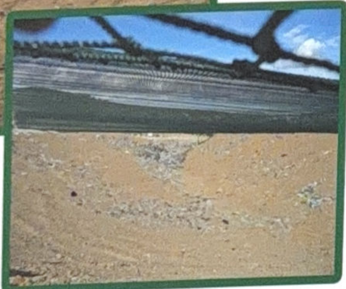
Clôture anti envol de papier et bassin de vidage par grand vent